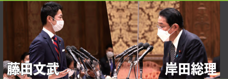
互いの考え方の違いが鮮明になった衆議院予算委員会